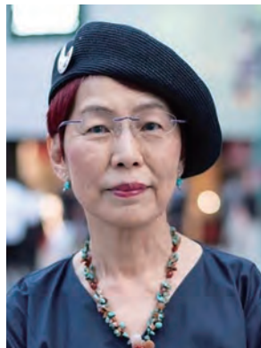
社会学者・東京大学名誉教授・ 認定NPO法人ウィメンズアクション ネットワーク (WAN) 理事長

1957年、東京生まれ。東京大学大学院情報学環教授。東京大学出版会理事長。1976年に東京大学理科I類に入学後、同大学教養学部教養学科卒業。同大学院社会学研究科博士課程単位取得退学。社会学・文化研究・メディア研究専攻。東大新聞研究所助教授、同社会情報研究所助教授、教授を経て現職。2006～08年度に東大大学院情報学環・学際情報学府長、2009～12年度に東大新聞社理事長、2010～14年度に東大副学長、同教育企画室長、同大学総合教育研究センター長、同グローバルリーダー育成プログラム推進室長、2010～13年度に東大大学史料室長等を歴任。1993～94年にエル・コレヒョ・デ・メヒコ大学院客員教授、1999年にウエスタン・シドニー大学客員教授、2017～18年にハーバード大学エドウィン・O・ライシャワー客員教授。集まりの場でのドラマ形成を考えるとところから近現代日本の大衆文化と文化政治を研究。演劇論的アプローチを基礎に、日本におけるカルチュラル・スタディーズの中心的存在として先駆的な役割を果たした。主な著書に、『大学とは何か』（岩波新書）、「文系学部廃止」の衝撃（集英社新書）、「大学はもう死んでいる？」（集英社新書）、「東大という思想」（東京大学出版会）、現代思想 2020年10月号 特集＝コロナ時代の大学（青土社）等、多数。