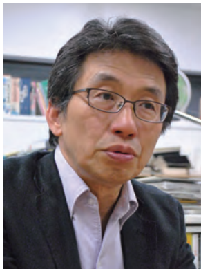
東京大学大学院情報学環教授・ 東京大学出版会理事長