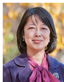
社会情報学部教授・ 国際センター長・副学長

東京学芸大学卒業、同大学院修士課程修了 筑波大学文部技官、助手を経て群馬大学着任 群馬大学共同教育学部特別支援教育講座教授 2013年 博士（教育学） 2008年～2010年 群馬大学学生支援センター障害学生支援室設立、 副室長 2014年 群馬県手話言語条例(案)研究会委員(座長代理) 2015年 前橋市手話言語条例制定研究会アドバイザー、 同意見交換会委員 2015年～群馬県手話施策推進協議会委員（副会長）ほか 2004年～日本高等教育感覚障害学生支援ネットワーク (PEPNet-Japan) 運営委員