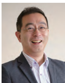
共同教育学部特別支援教育講座教授

1979年 千葉大学薬学部製薬化学科卒業 1984年 横浜国立大学大学院教育学研究科修士課程修了 1985年 大阪大学 工学博士 1979年 北里大学薬学部助手 1990年 群馬大学教養部講師 1993年 群馬大学工学部助教授 2005年 群馬大学工学部教授 2013年～群馬大学大学院理工学部教授 2015年～副学長 2015年 群馬大学男女共同参画推進室長 2020年～群馬大学ダイバーシティ推進センター長